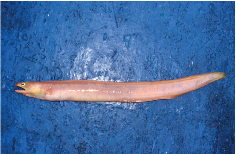
Figura 1. Dos especies guineanas poco conocidas: Pseudogramma guineensis (arriba) y Myroconger compressus (abajo).