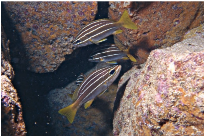
Figura 3. Parapristipoma humile (arriba y centro) y P. octolineatum (abajo).