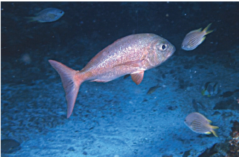
Figura 2. Especies pertenecientes a géneros monotípicos endémicos de las islas de Cabo Verde: Similiparma hermani (arriba) y Virididentex acromegalus (abajo).